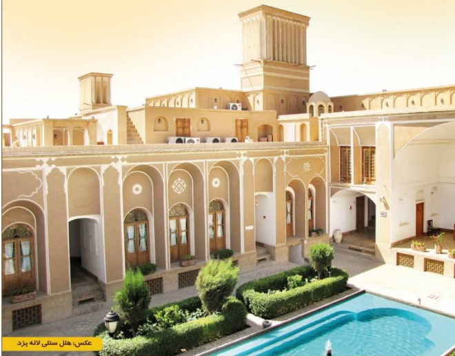
عکس: هتل سنتی لاله یزد

زمان برگزاری: سه شنبه ۳ اردیبهشت ۹۸ (۱۶ الی ۲۰)